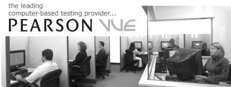
Fra et testsenter.

Et sikkert alternativ er imidlertid å dra til Pearsons VUEs lokaler midt i London. Jeg gjorde dette selv og kan bekrefte at det hele foregår svært profesjonelt. Ingredienser i «høysikkerhets-konseptet» består blant annet av krav om to former for legitimasjon med bilde, fingeravtrykk, ransaking ved inngang, ingen mat eller drikke i lokalene, ikke lov å ta med blyant og papir inn, samt plassering i en kameraovervåket bås. Hele lokalet overvåkes av en vakt i et glassbur som sitter foran fire-fem flatskjermer som mottar bilder fra et ukjent antall kameraer. At det var grosset fullt, er ikke å ta for hardt i. Jeg satt inne på et rom med et snes andre eksaminander («examinanders», eller kandidater). Ingen av dem tok BCBA, så vidt jeg kunne se. Enkelte fikk vite resultatet av eksamen i resepsjonen umiddelbart etterpå, noe en kvinne som strigråtende forsøkte å kommunisere dårlige nyheter videre på mobiltelefon bar vitnesbyrd om. Hele settingen kan muligens bli litt overveldende for en nordmann, men den kan også sees på som en nyttig erfaring og et innblikk i hva fremtiden kan bringe.